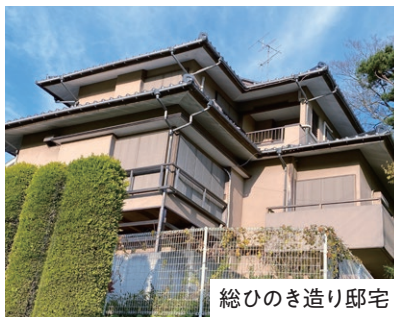
総ひのき造り邸宅